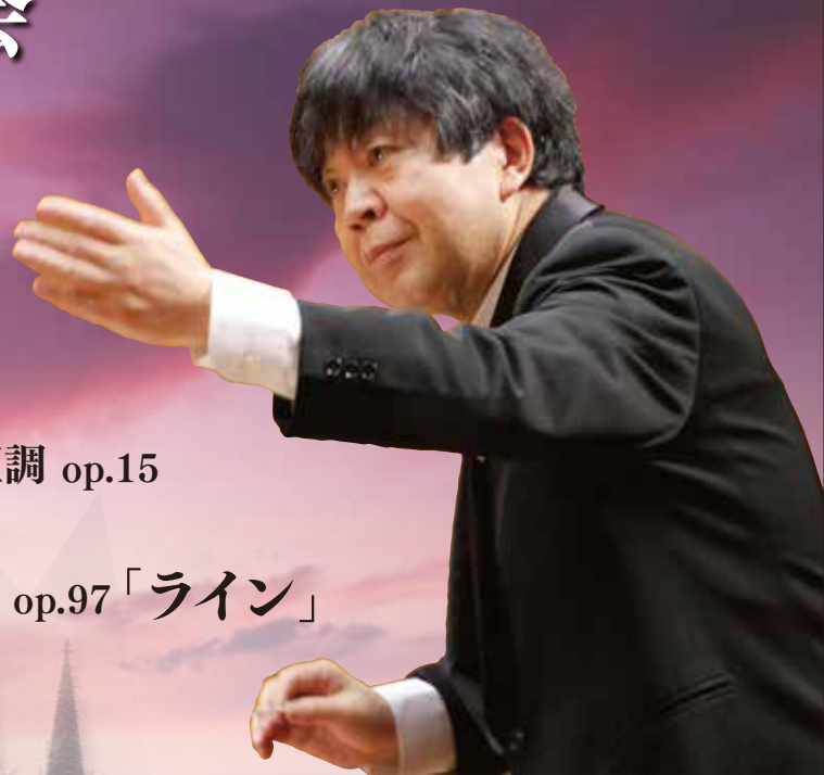
指揮 高関 健 (首席指揮者)