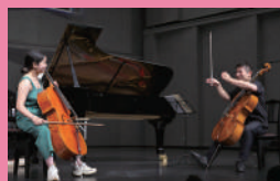
ローム ミュージック セミナー